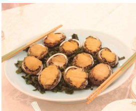
※写真はいちご煮、アワビの参考イメージです